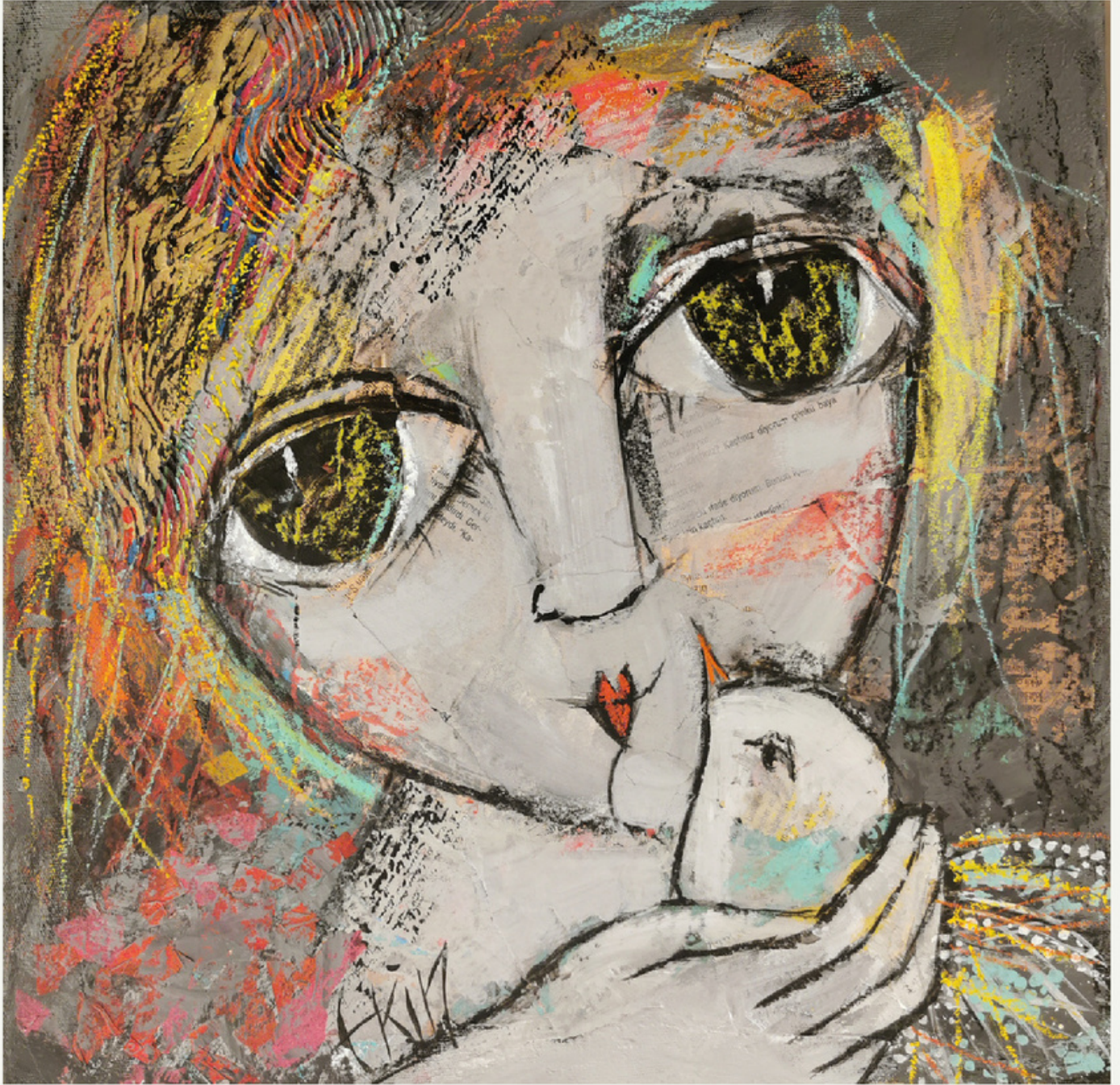
40x40 cm / tükt / 2022