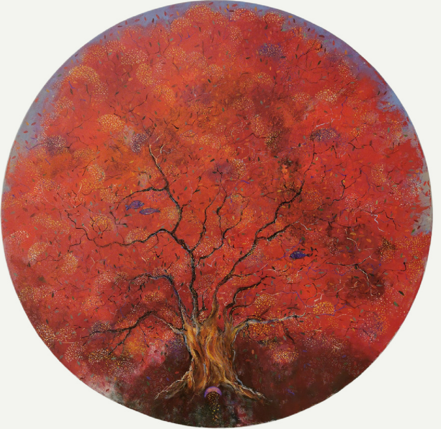
R:80 cm / tüab / 2023 / "hayat ağacı"