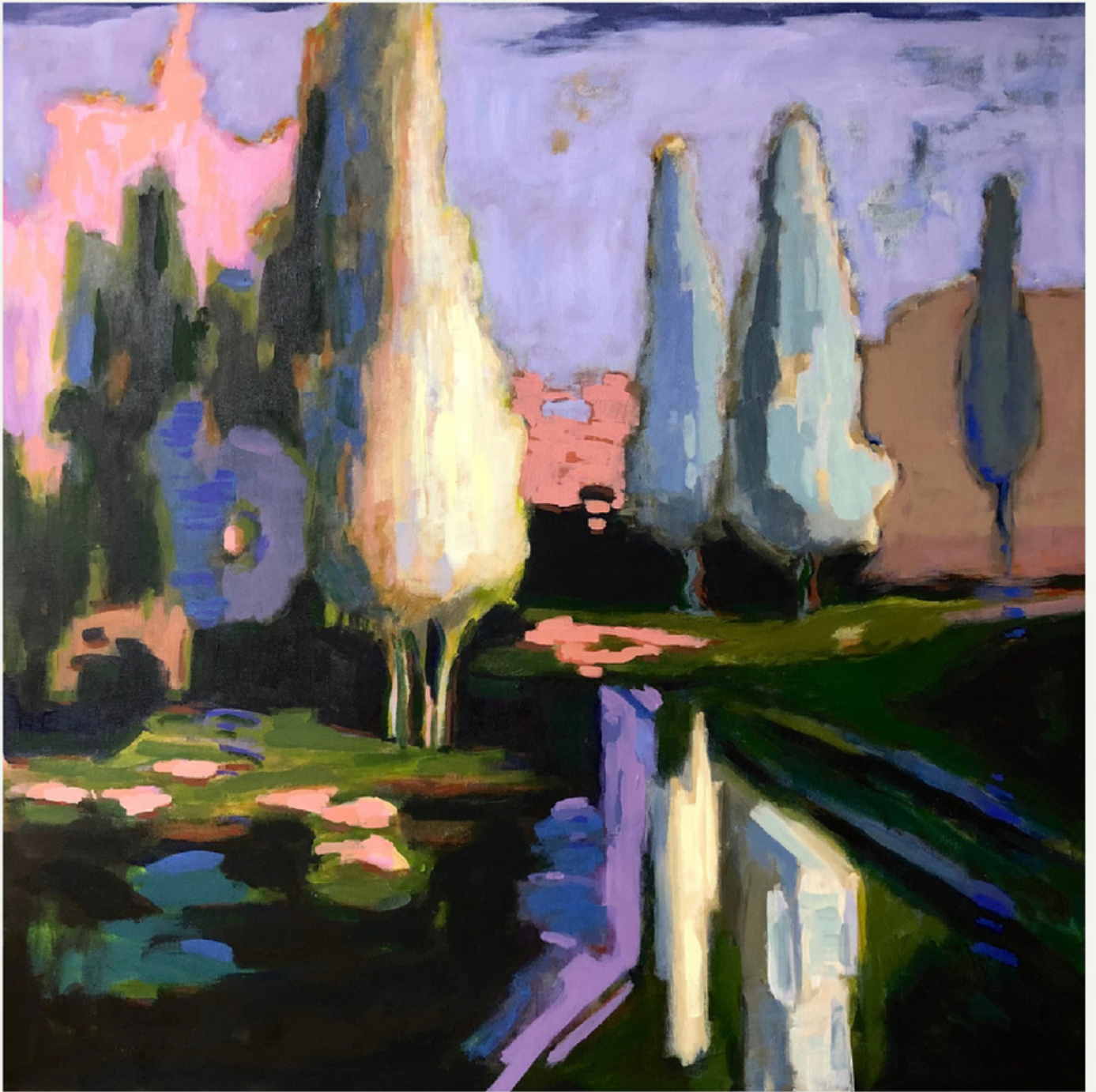
80x80 cm / t y b / 2023