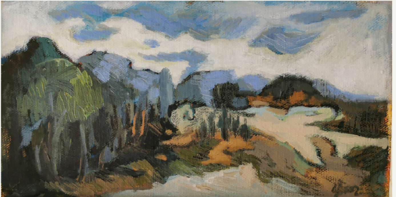
13x25 cm / t y b / 2018