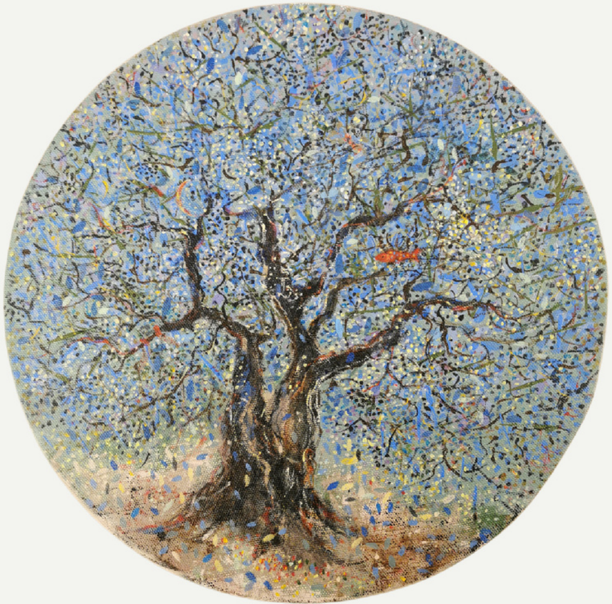
R:30 cm / tüab / 2023