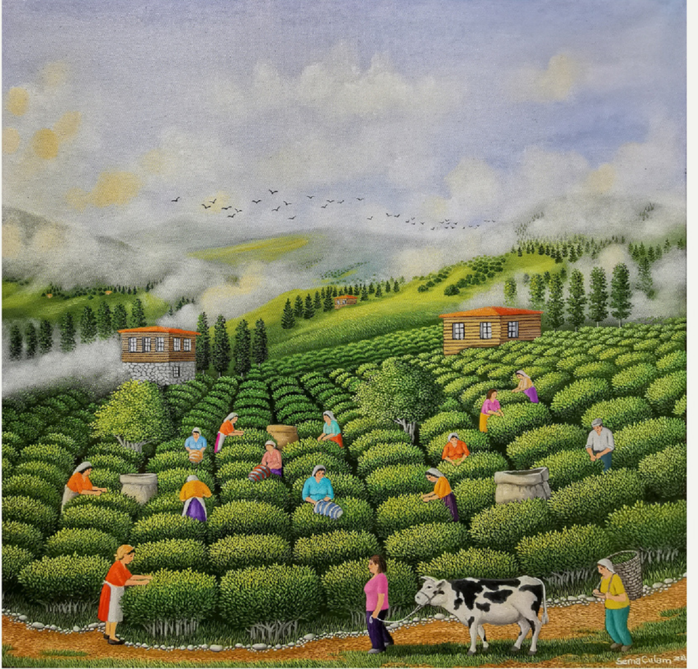
60x60 cm / t y b / 2023