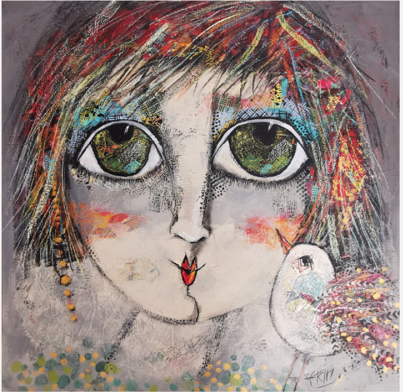
70x70 cm / tükt / 2022