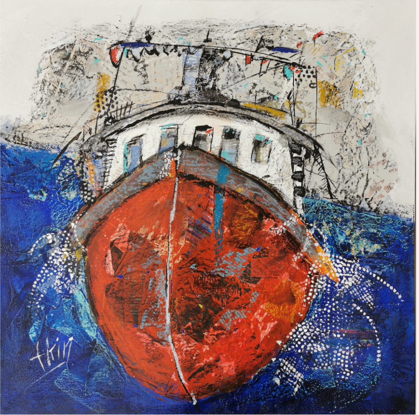
60x60 cm / tükt / 2022