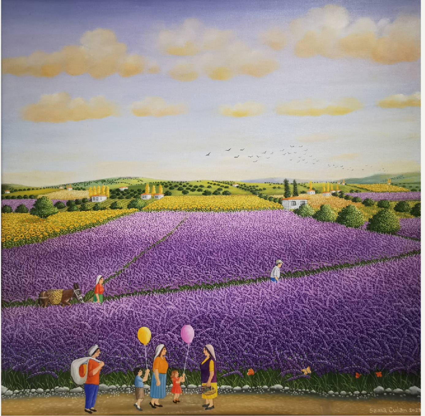
60x60 cm / t y b / 2023