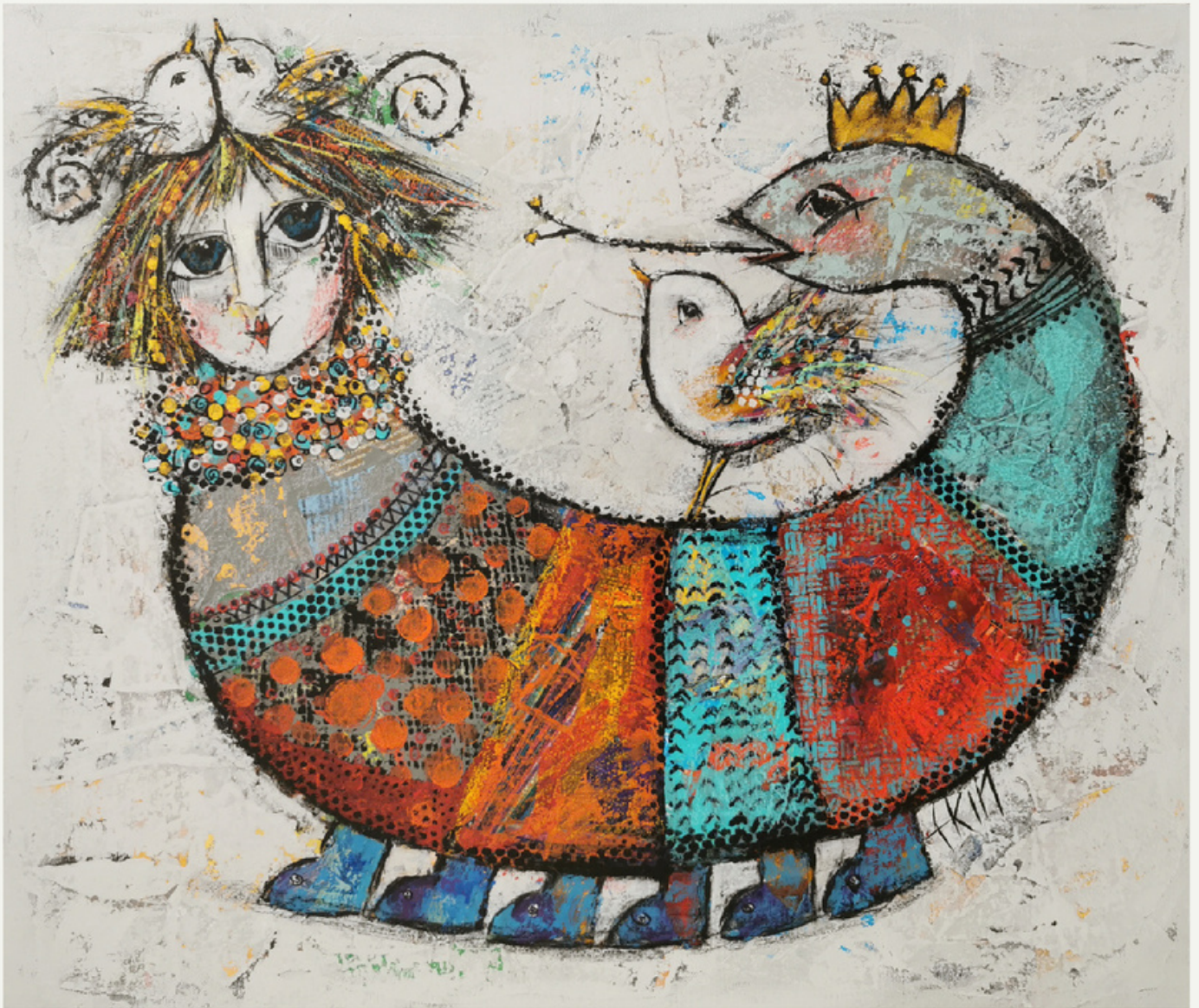
60x70 cm / tükt / 2022