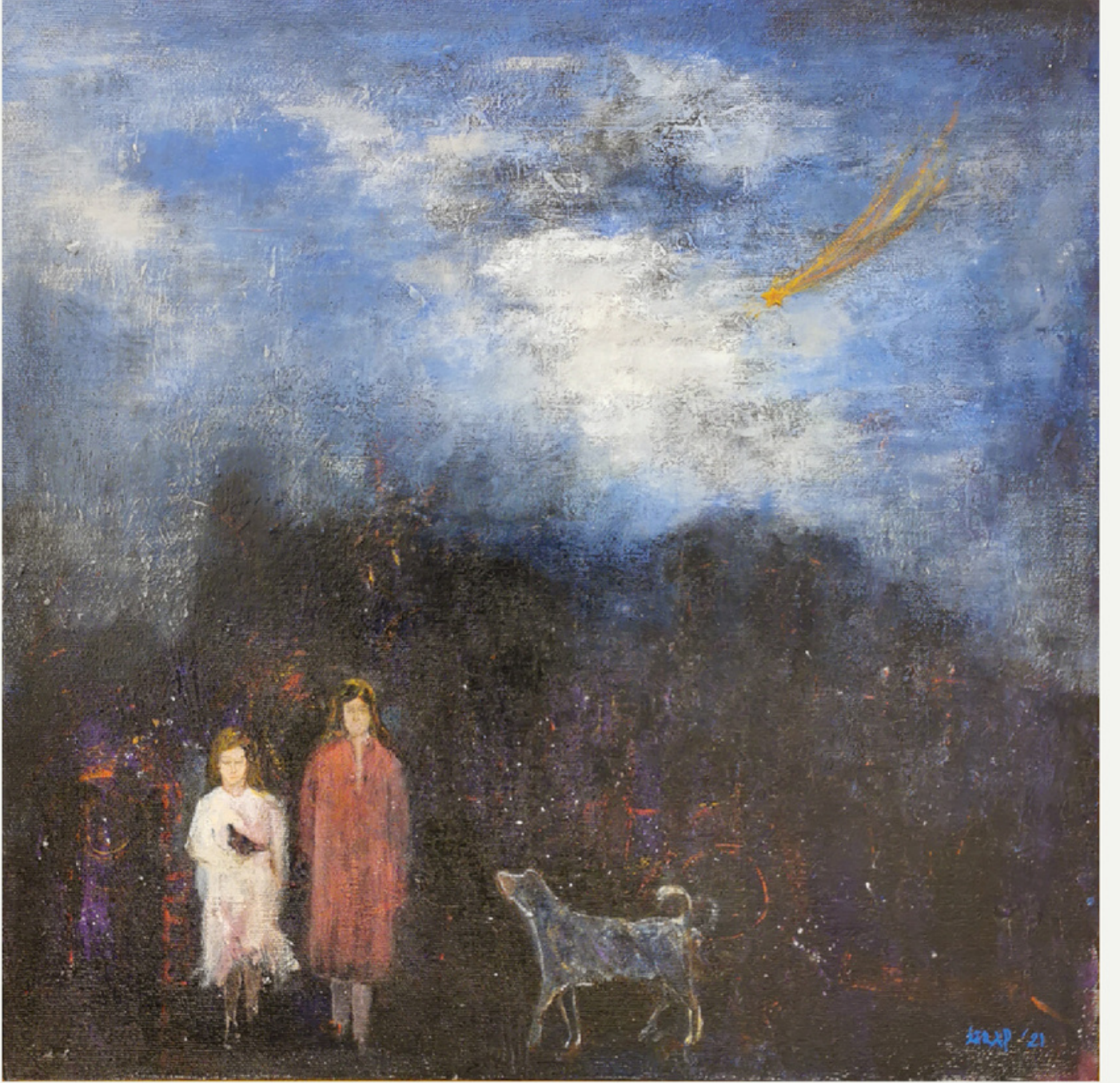
40x40 cm / t ab / 2021 / "bir varmıř, bir yokmuř"