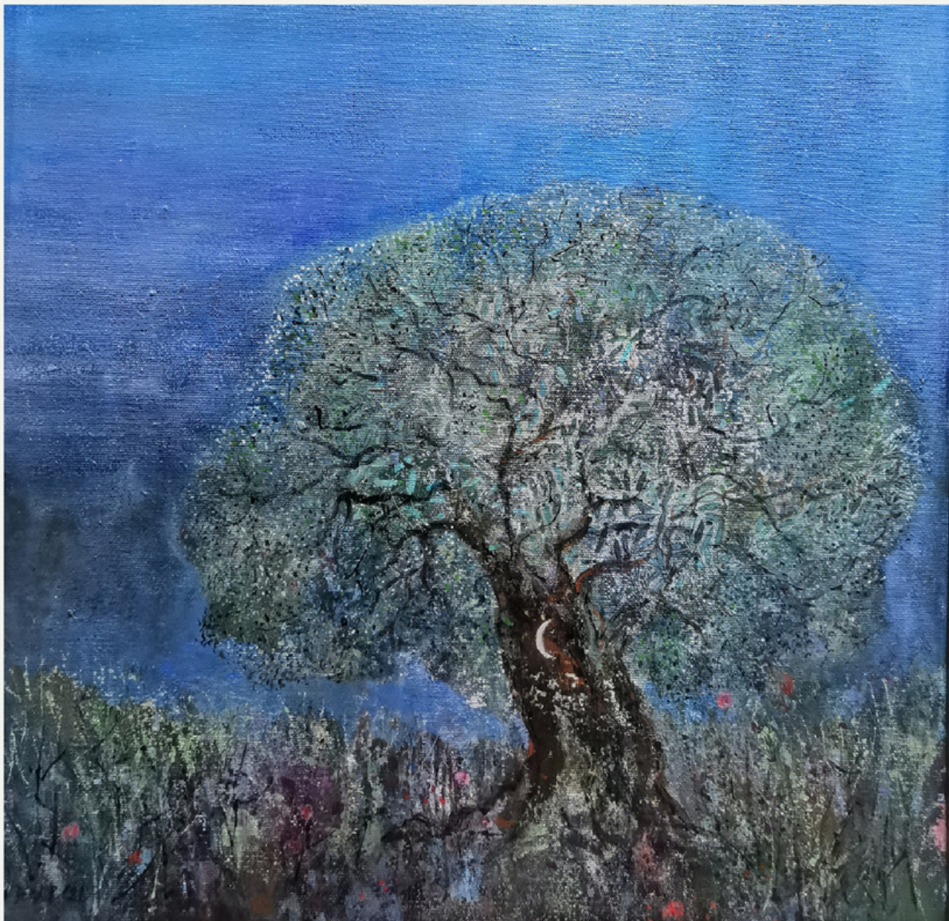
38x39 cm / t ab / 2021 / "hilal"