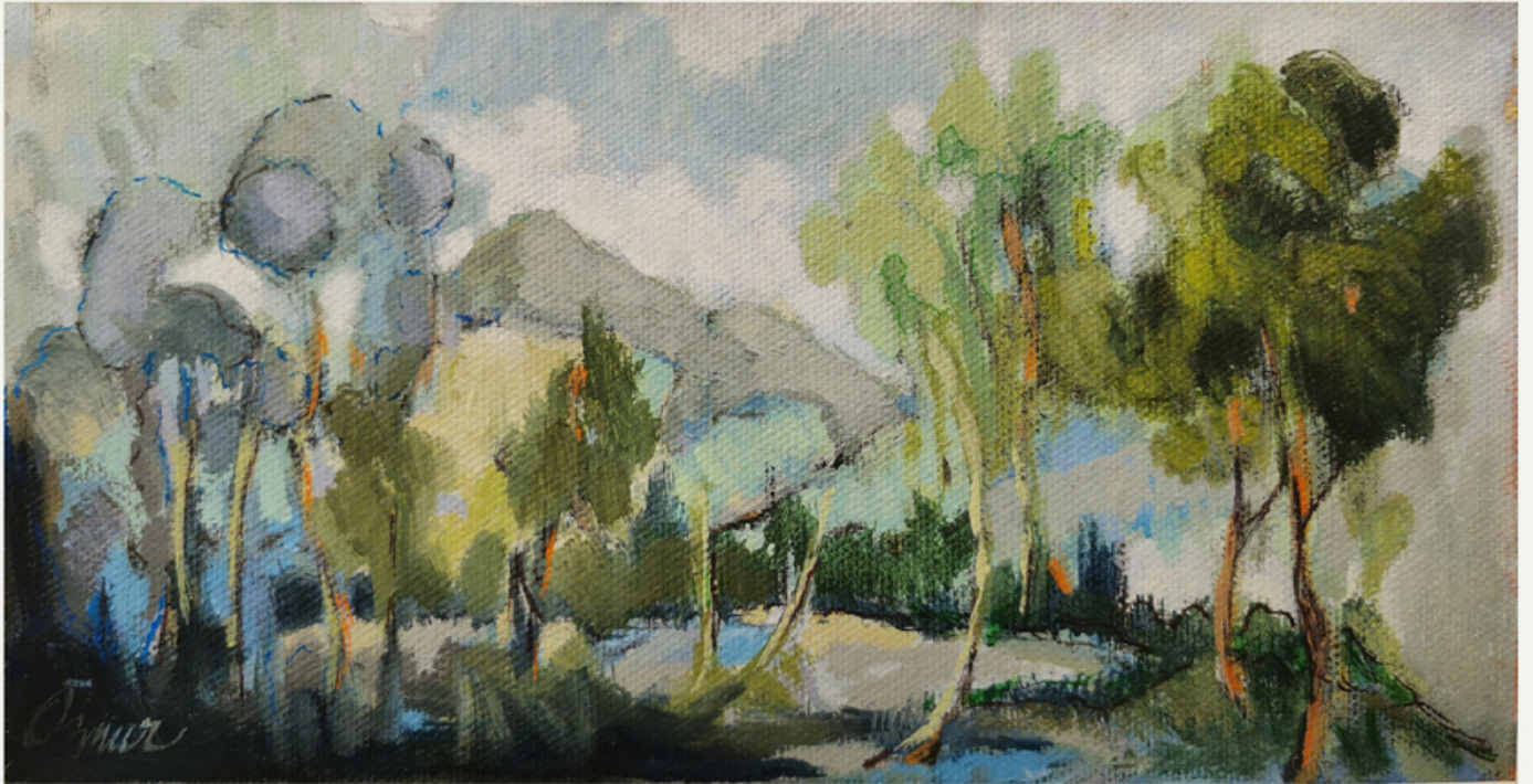
13x25 cm / t y b / 2018