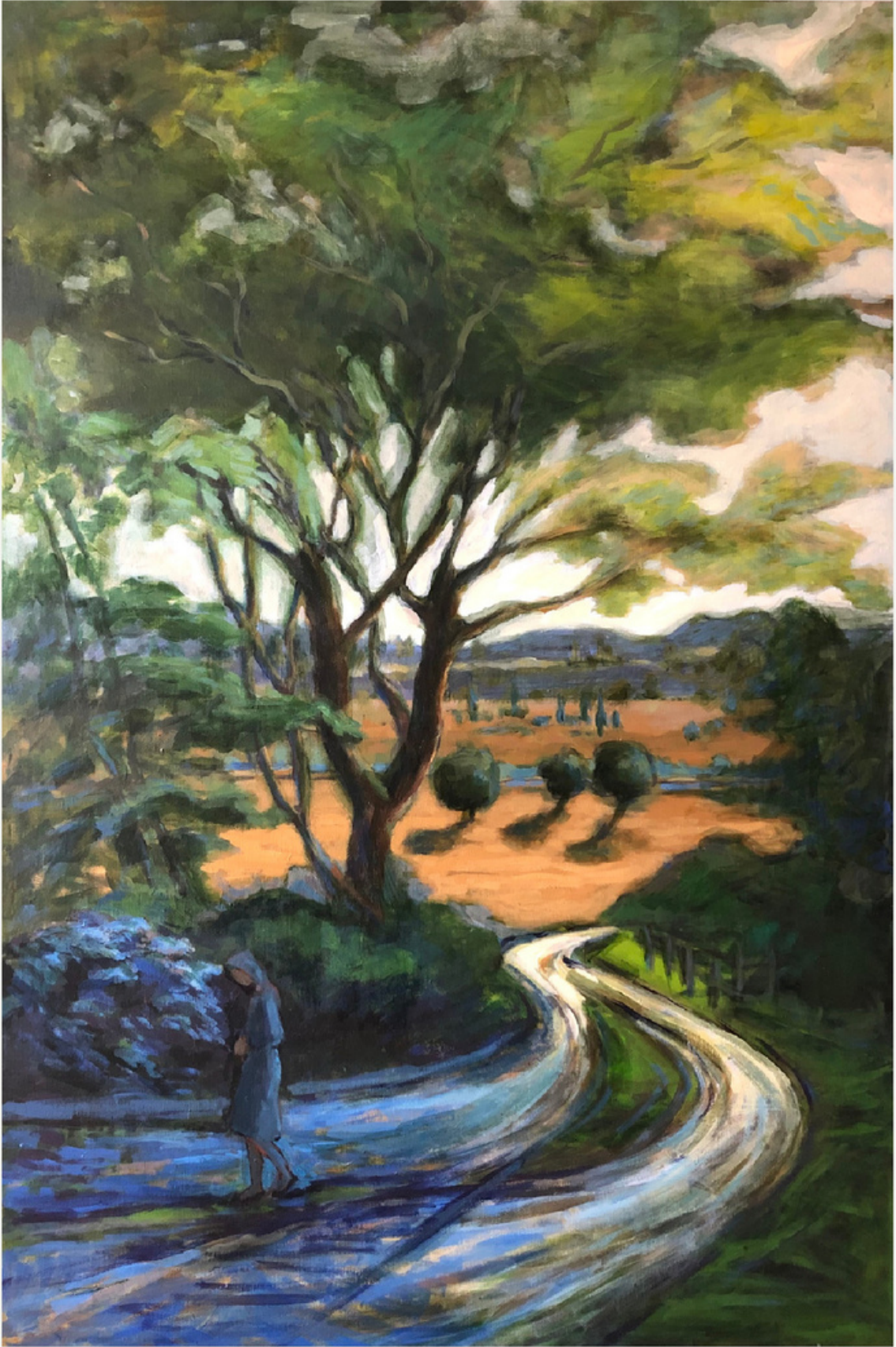
120x80 cm / t y b / 2023