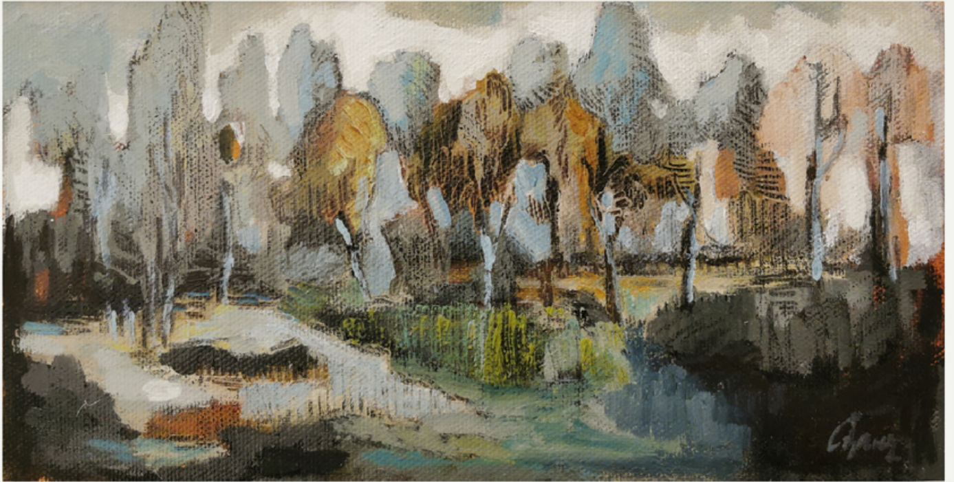
13x25 cm / tyb / 2018