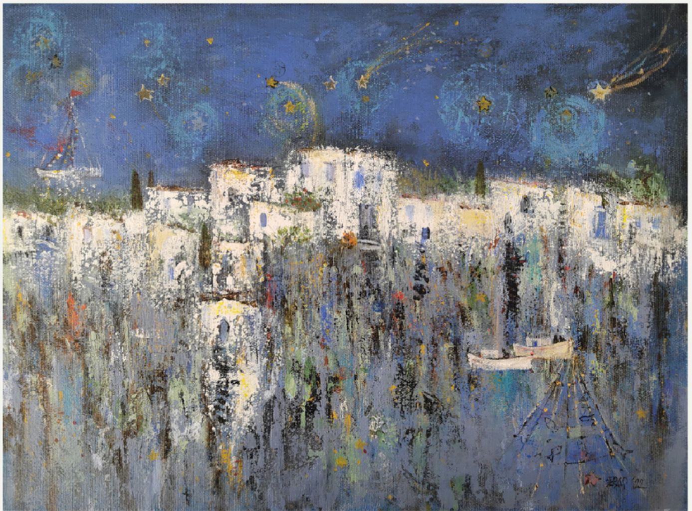
30x40 cm / tšab / 2022 / "bodrum"