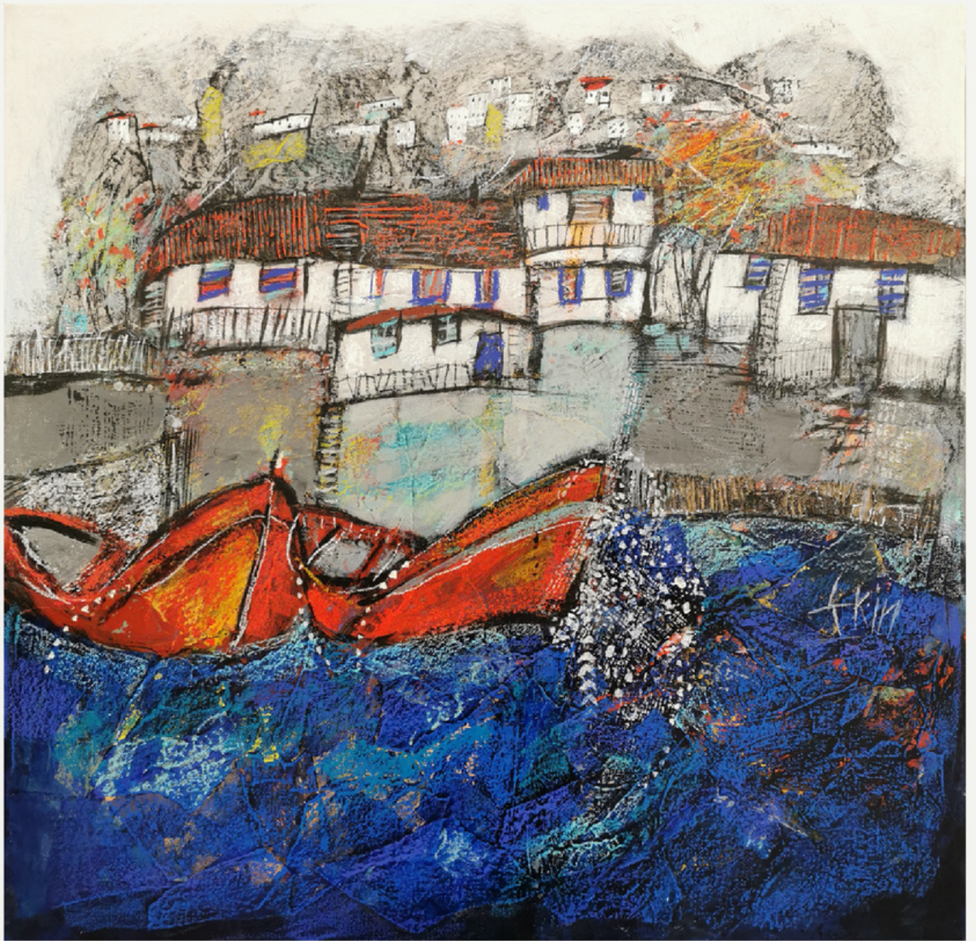
60x60 cm / tükt / 2022