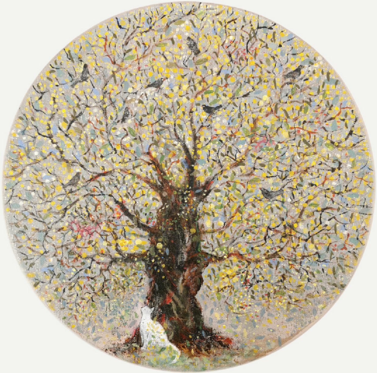
R:30 cm / tüab / 2023