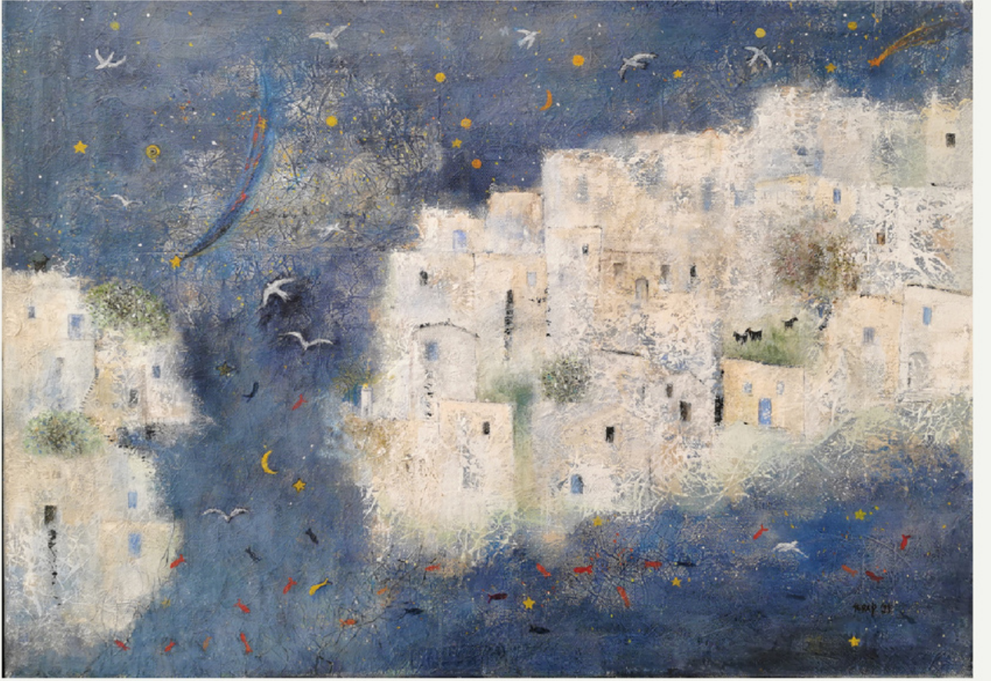
50x70 cm / tüab / 2023 / "dilek yıldızı"