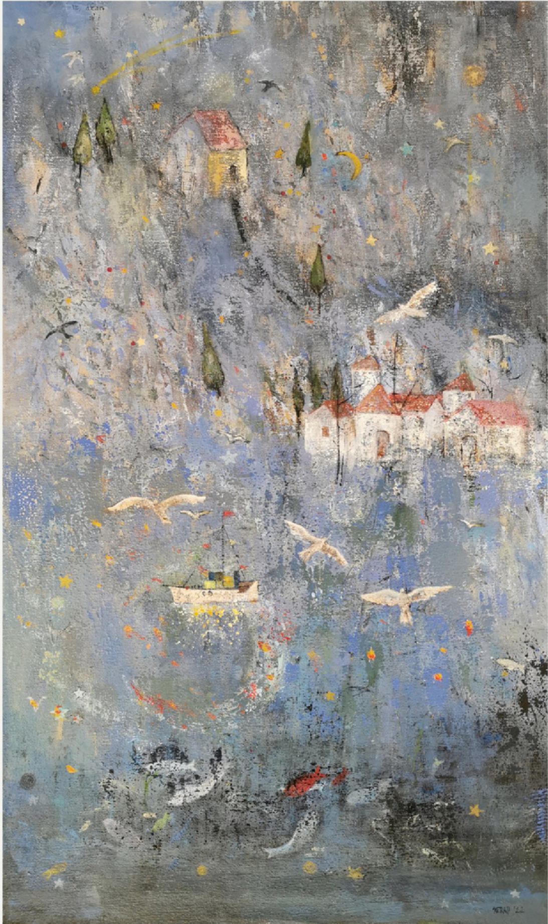
84x50 cm / tūab / 2022 / "rüya"