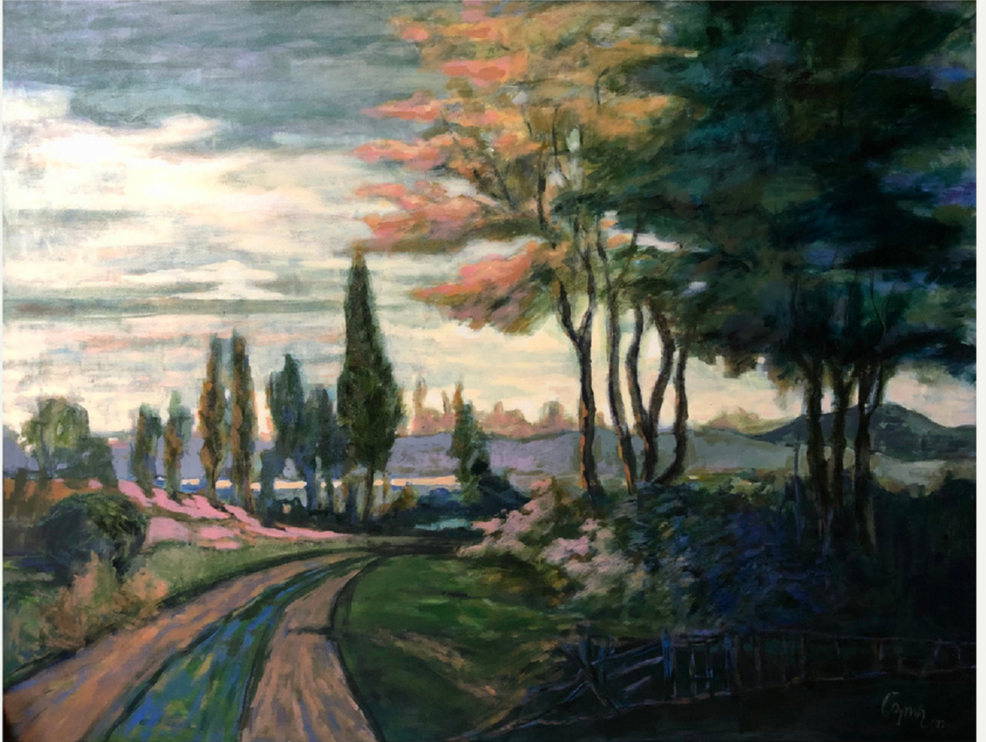
98x128 cm / tyb / 2022