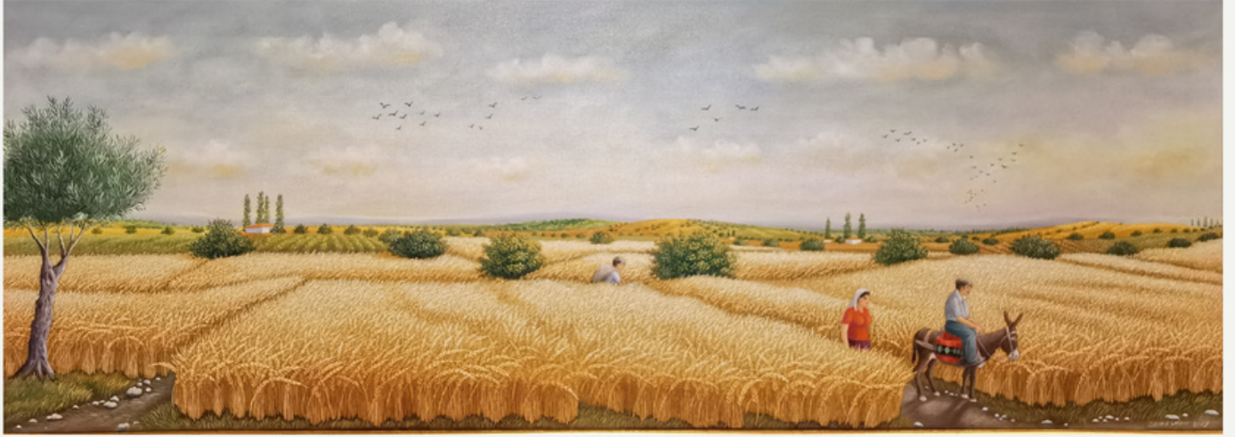
40x110 cm / tyb / 2017