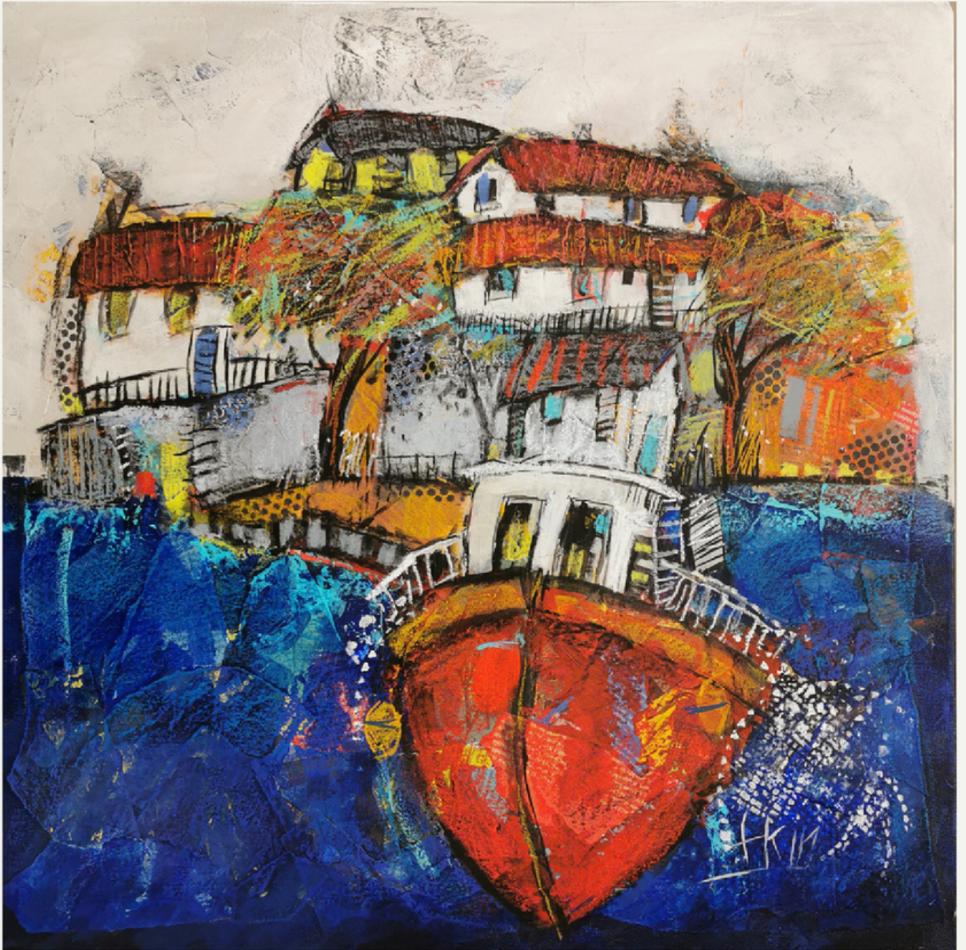
60x60 cm / tükt / 2022