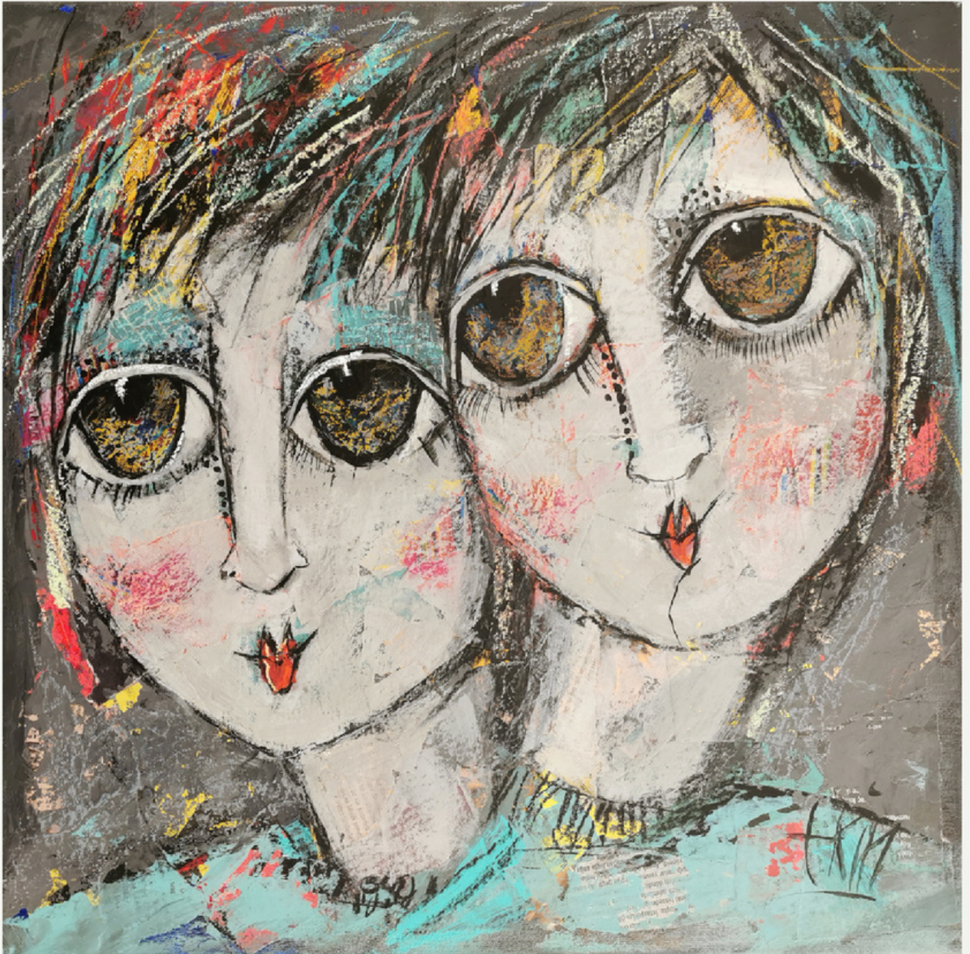
50x50 cm / tükt / 2022