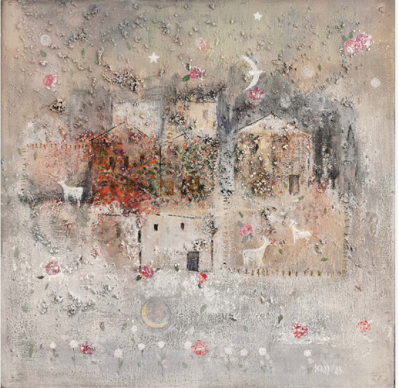
30x30 cm / tūab / 2023 / "gül kokulu köy"