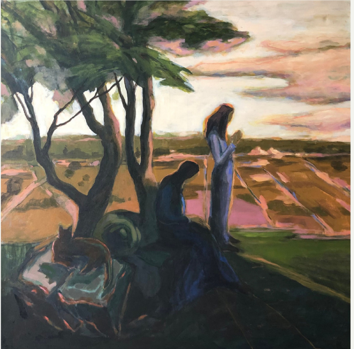
80x80 cm / t y b / 2023