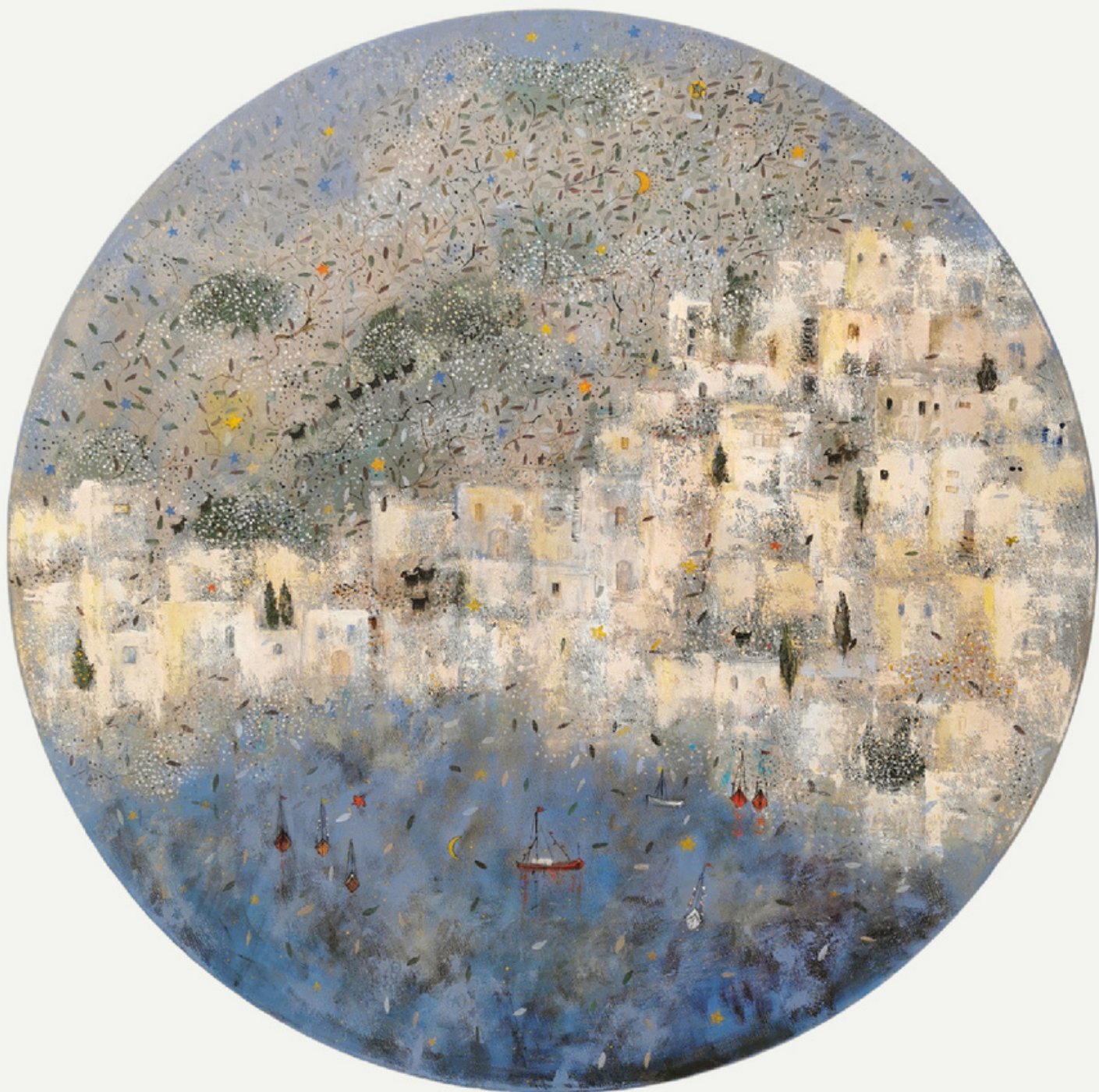
R:80 cm / tüab / 2023 / "köy"